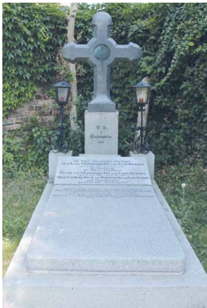
Hrob rodiny Beck von Mannagetta und Lerchenau na hřbitově v Klosterneuburgu u Vídně.

Radek Polách, Pavel Šustala, Muzeum Novojičínka, Státní okresní archiv Nový Jičín