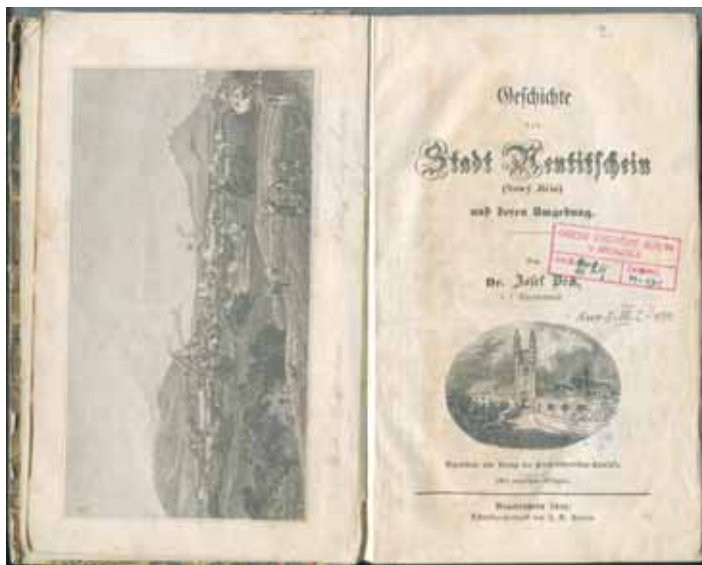
Titulní strana nejstarší publikace k dějinám Nového Jičína z roku 1854.