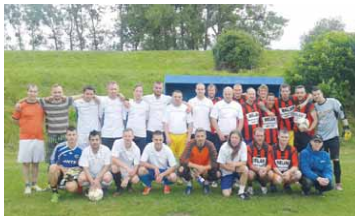
A-tým a bývalý dorost z roku 2005.