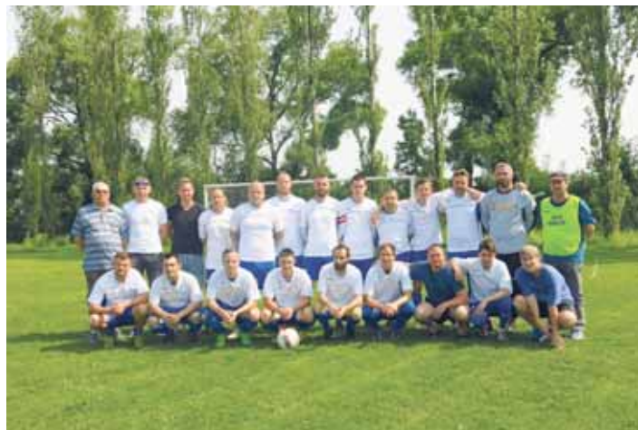
A-tým z roku 2019.

V dnešní době máme 3 oddíly přípravky, mladší žáky a mladší dorost a co nejdříve je plánujeme doplnit o starší žáky a starší dorost. Za