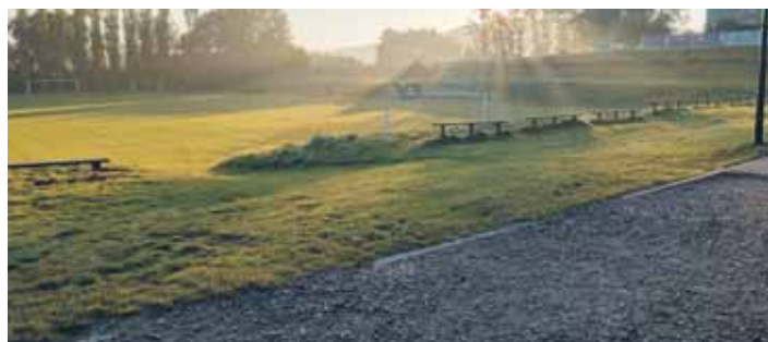
Hřiště na Lamberku ve Štursově ulici za hospodou Na Prachárně.