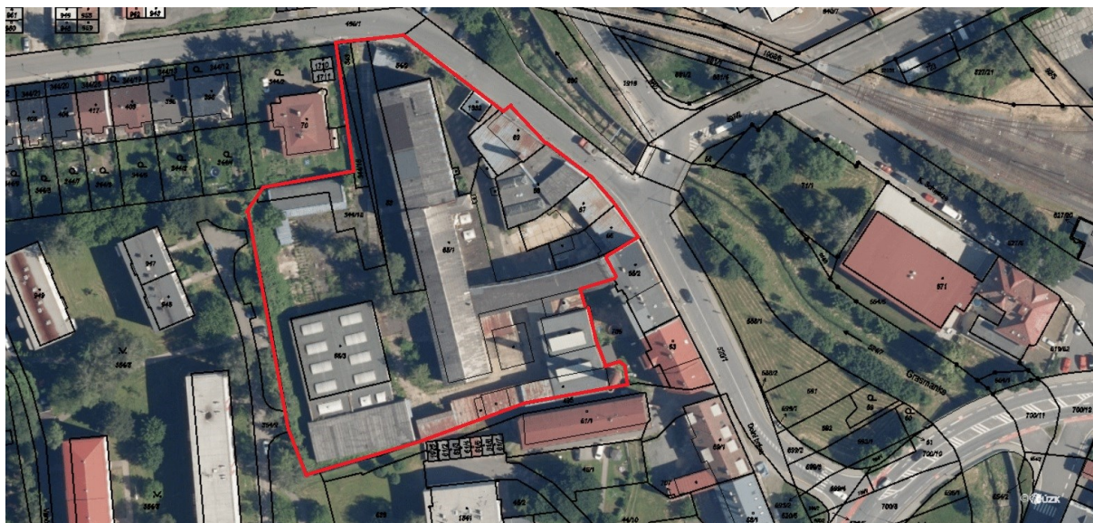
Obr. 3 Výřez ortofotomapy Nového Jičína s vyznačením zamýšlené Změny č. 9

územně analytické podklady obec s rozšířenou působností oblast NATURA 2000 (Evropsky významná lokalita a (Ptačí oblast) geometrický plán odbor životního prostředí veřejně prospěšná opatření