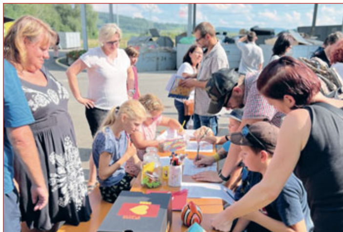
Slavnostní otevření REUSE centra provázely workshopy pro děti.