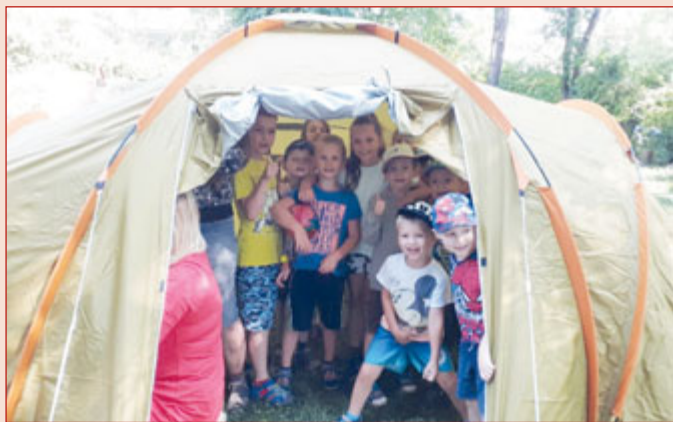
Spaní ve stanu si na zahradě školky užily děti z mateřinky na Máchově ulici.

Děti z Mateřské školy Trojlístek na Máchově ulici prožily krásné dobrodružné odpoledne a taky večer. Spolu s rodiči si postavily na zahradě stanové městečko, vybalily spacáky a něco dobrého k snědku. Pro děti bylo připraveno plno zábavy, soutěžní pohybové disciplíny, opékání špekáčků. To nejdůležitější, na co se děti nejvíce těšily, přišlo až večer – letní kino. Děti zhlédly film, který si samy vybraly. Všichni jsme si zažili spoustu zábavy a legrace a už teď se těšíme na další prázdniny.