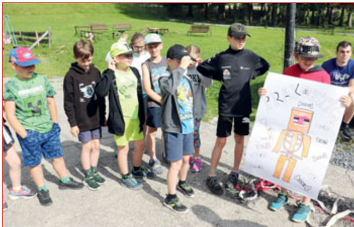
Čtvrtáci na „pravěké“ škole v přírodě.

V červnu se po dvouleté covidové pauze rozjely hned tři ročníky Základní školy Komenského 66 do škol v přírodě. A protože těšení bylo veliké, chtěli si to všichni zúčastnění pořádně užít.