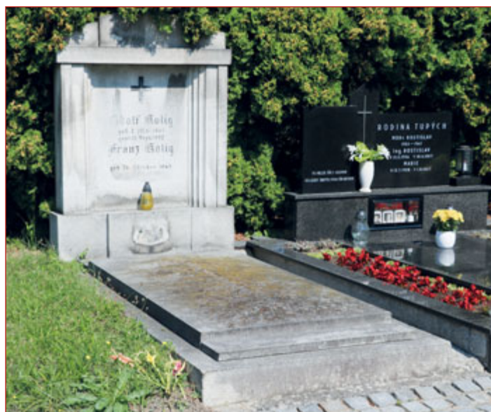
Náhrobek rodiny Koligů na novojičínském hřbitově v roce 2022.