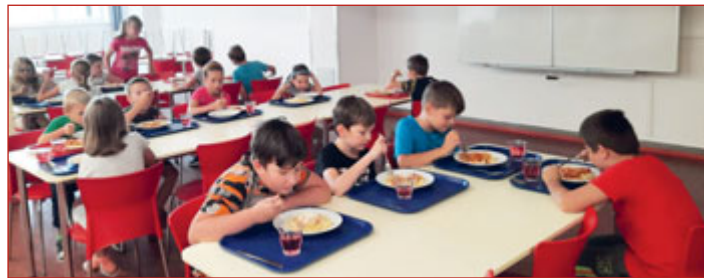
Školní jídelna byla plná i o prázdninách.