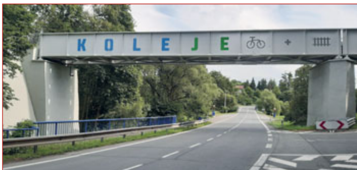
Pohled na opravený viadukt, po kterém cyklostezka Koleje odbočuje směrem k Čertáku.

„V rámci pořádaných akcí se občané mohou třeba těšit na oblíbenou Podzimní cyklojízdu, kterou jsme naplánovali na pátek 16. září. Startujeme v 16:00 hodin na Horním nádraží, odkud se společně vydáme po cyklostezce Koleje na novou odbočku přes bývalý železniční most a Tropicke údolí k výletní lokalitě Čerták, kde bude připraven doprovodný program pro děti i dospělé,“ popsal místostarosta a politik Zdravého města Ondřej Syrovátka.