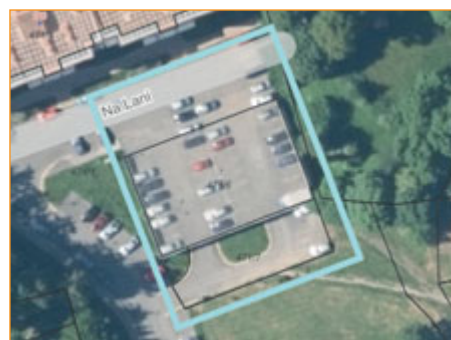
Ohraničené staveniště kolem krytého stání.

Vnitřní práce zahrnují opravy omítek, podlahy a osvětlení. Vjezd