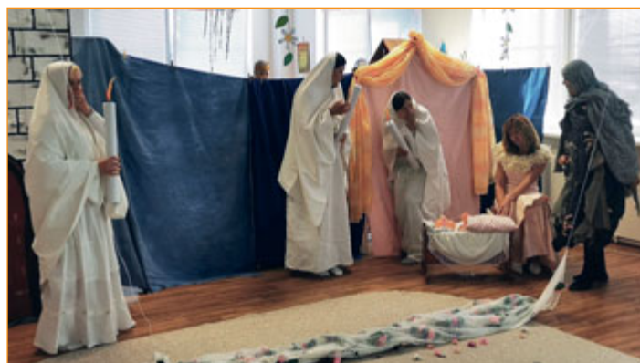
Zaměstnanci školky Jiráskova sehráli dětem svou verzi pohádky O Šípkové Růžence.