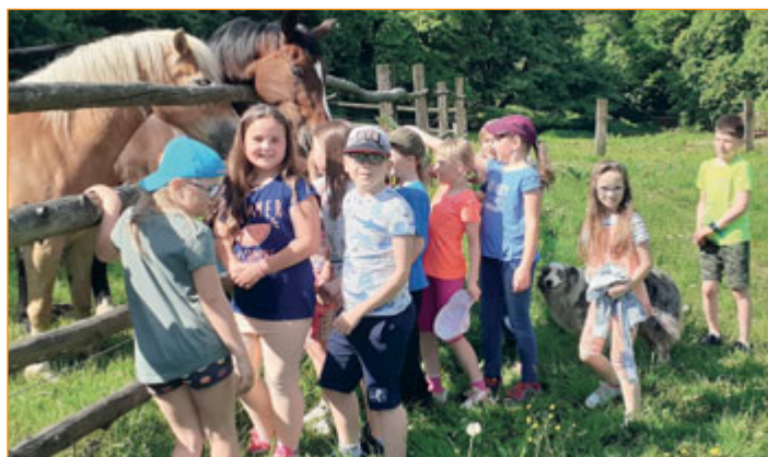
Školáci z Komenského 66 u koní na ranči v Bludovicích.

Dopoledne na Ranči Na kopci v Bludovicích prožili počátkem června žáci 2. A Základní školy Komenského 66. Na tento výlet za zvířaty se děti velmi těšily. Hned po příchodu se nás ujal majitel ranče a provedl nás celým areálem. Pro děti bylo zajímavým zážitkem vidět zvířata v překrásném prostředí pastvin a lesů. Po výstupu do strmého kopce kolem staré sjezdovky jsme došli k bývalému ovčínu, u kterého jsme viděli koně a malá prasátka, která si mohly děti hladit a nakrmit je. Na zavolání majitele se z lesa vynořilo skotské plemeno krav a býků, kteří nás vítali hlasitým bučením. Na ranči žijí také kočky, pastevecký pes a nechyběl ani poník, se kterým si děti hrály.