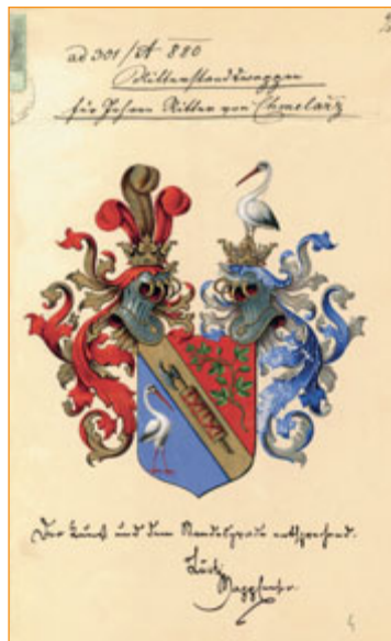
Erb rytířů von Chmelarž z roku 1880.