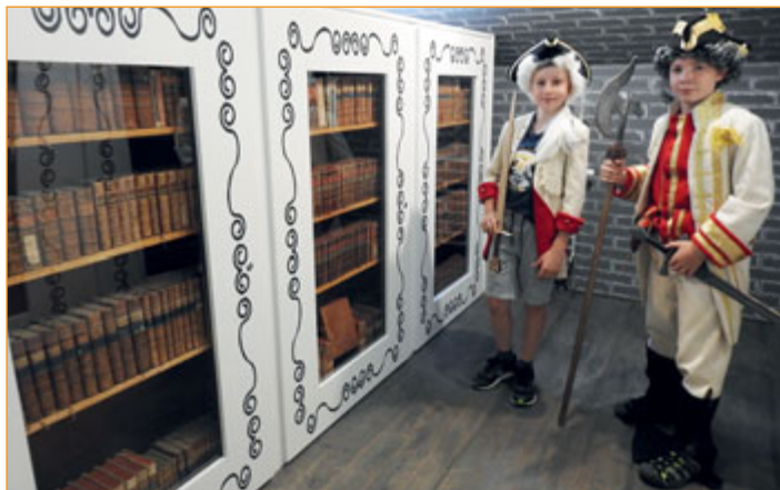
Nové vitríny v expozici Návštěvnického centra ukrývají asi tisíc tisků ze slavné Laudonovy knihovny.

Novojičínská expozice generála Laudona byla rozšířena o slavnou knihovnu tohoto vojevůdce. Přes tisíc svazků s erbem či jeho osobním popisem se po dvaceti letech uzavření v depozitáři Muzea Novojičínska přiblížilo veřejnosti. Sbírkou knih převzalo Návštěvnické centrum, které sídlí na Masarykově náměstí v domě, kde v roce 1790 polní maršál zemřel. Dlouhodobé zapůjčení tisků umožnilo Národnímu muzeu Praha, kterému knihovna patří.