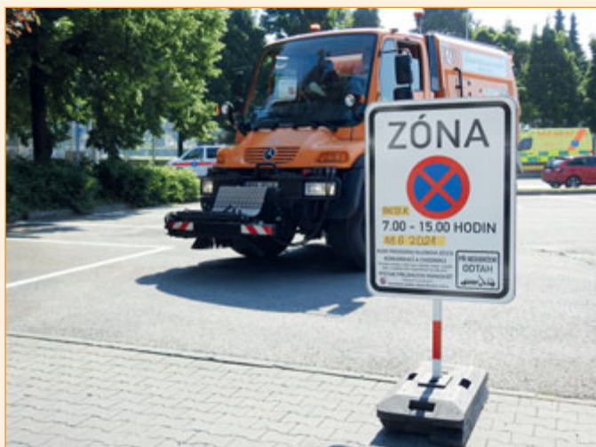
Na rajónový úklid města upozorňují minimálně týden dopředu tyto značky.

Práci jim bohužel komplikují neukáznění motoristé, kteří nereagují na upozornění technických služeb a výzvu, aby v daném termínu na ulici či parkovišti neodstavovali svá vozidla.