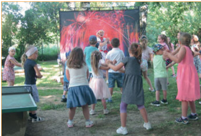
Připravený program děti poveselil a rozpohtyboval.

Dětem v Loučce patřila středa 9. června, kdy zde Jednota Orel ve spolupráci s místní mateřskou školou uspořádaly Den dětí.