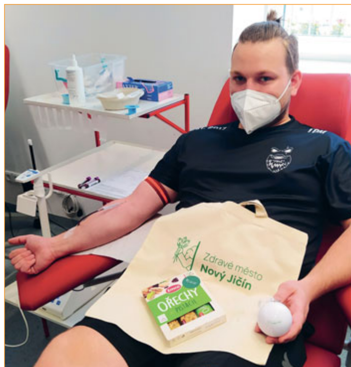
Dárek od Zdravého města Nový Jičín si zasloužili všichni, kdo přišli darovat krev v květnové úterky a také na Medarda. Speciálně byli taškou s logem Zdravého města, pláštěnkou v praktickém minibalení a sladkostí oceněni prvodárci.