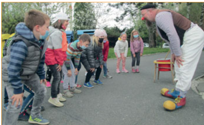
Zdravotní klaun rozveselil děti na Základní škole Jubilejní.