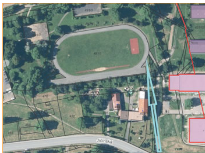
Zelená šipka ukazuje k náhradnímu stání.