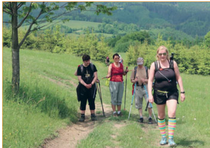
Novojičínské turisté podnikli výlet do Bílých Karpat.

První červnovou sobotu Klub českých turistů, odbor Turisti Nový Jičín uspořádal autobusový zájezd pro všechny, kteří se rádi toulají přírodou a poznávají nová místa. Vycházeli jsme z města Valašské Klobouky. Odtud jsme se vydali lesem k dřevěné rozhledně Královec s nádhernými výhledy na Vizovické vrchy a panorama Bílých Karpat. Trasa dál vedla rozkvetlými loukami po česko-slovenském pomezí. Na mnoha místech se naskytly výhledy na moravská i slovenská pohorí. Cílem výletu bylo městečko Brumov, kde někteří turisté absolvovali prohlídku zříceniny královského hradu.