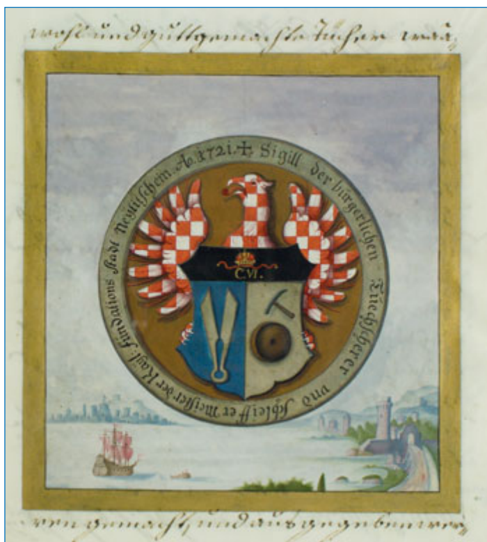
Výřez znaku postřevačského a brusičského cechu z listiny císaře Karla VI. z roku 1721.

Enders ilustrovaný časopis Die Biene – Včela; 5. června se narodil Josef Blum, významný novojičínský stavitel