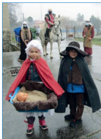
Tři krále přivítaly v mateřské škole Komenského děti převlečené za Marii a Josefa.