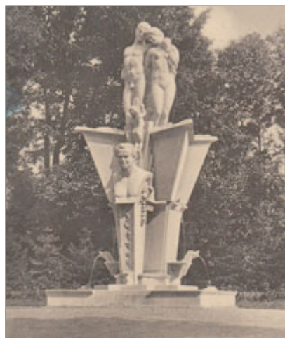
Pomník J. G. Mendela, odhalený v roce 1931 v dnešních Smetanových sadech.

1926 – před 95 lety byly otevřeny budovy škol na Palackého ulici, zahájeny práce na kanalizaci mlýnské strouhy, která tekla po dnešní Zborovské a Sokolovské ulici, došlo k zestátnění novojičínské policie a ustanovení státního policejního komisařství