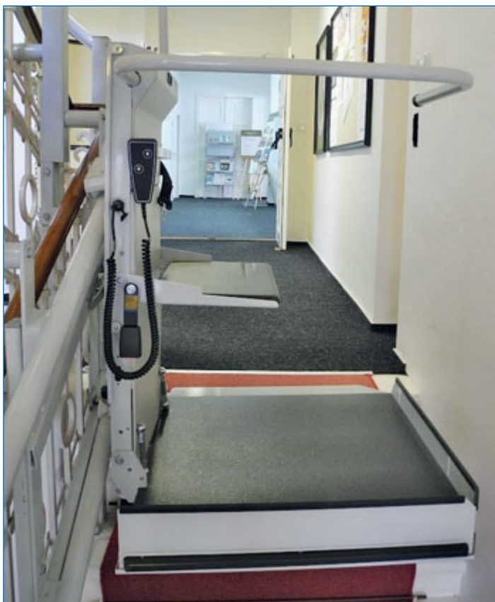
Nová plošina pro imobilní čtenáře na schodišti knihovny.