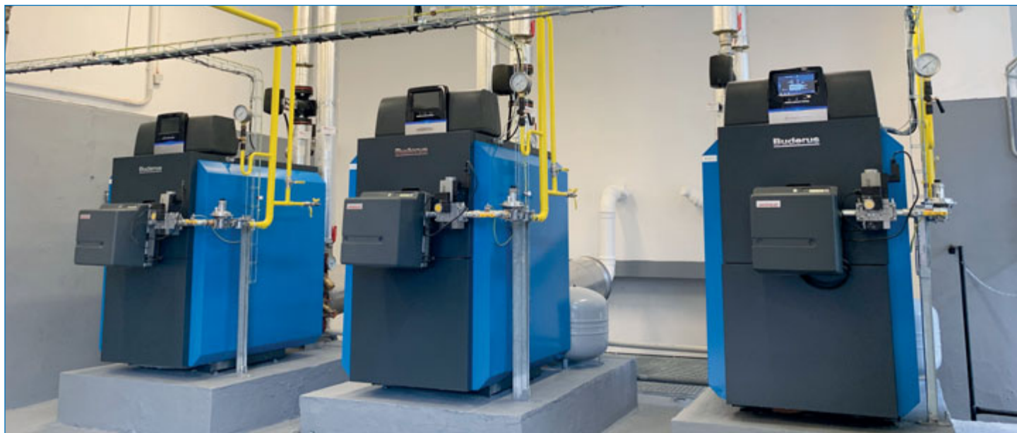
V loňském roce zmodernizovaná kotelna, která dodává teplo a teplou vodu do domu zvláštního určení pro seniory a tělesně postižené občany v ulici U Jičínky.