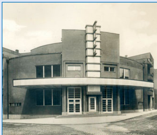
Novojičínské kino bylo postaveno podle projektu architekta Leo Kammela.