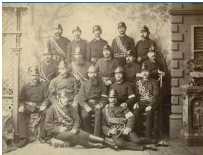
Jedna z nejstarších fotografií dobrovolného hasičského sboru v Novém Jičíně, konec 19. století.