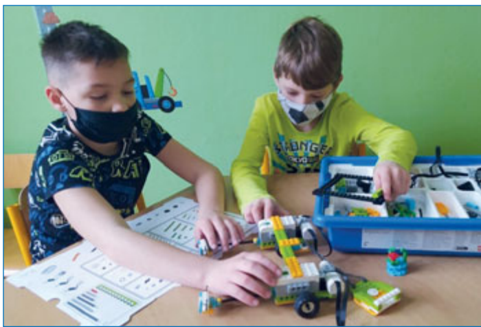
Třetáci při vzdělávacích aktivitách na „hodinách Qiido“.

Třetím rokem spolupracuje Základní škola Komenského 68 s nadací Qiido, která se věnuje rozvoji mimořádně nadaných dětí, a nyní je také její partnerskou školou. Učitelé, kteří s těmito dětmi pracují, v tomto období nezáhálejí a se svými zvidavými žáky bádají, programují, objevují online.