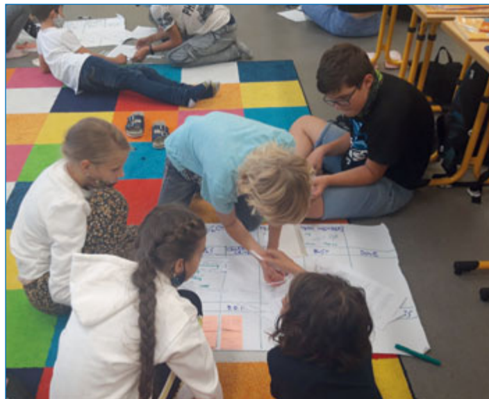
Školáci Galaxie při výuce metodou eduScrum.