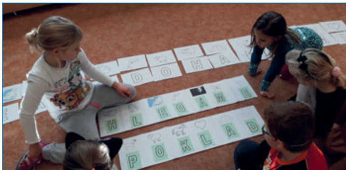
Děti při námětové hře Hledání pokladu.