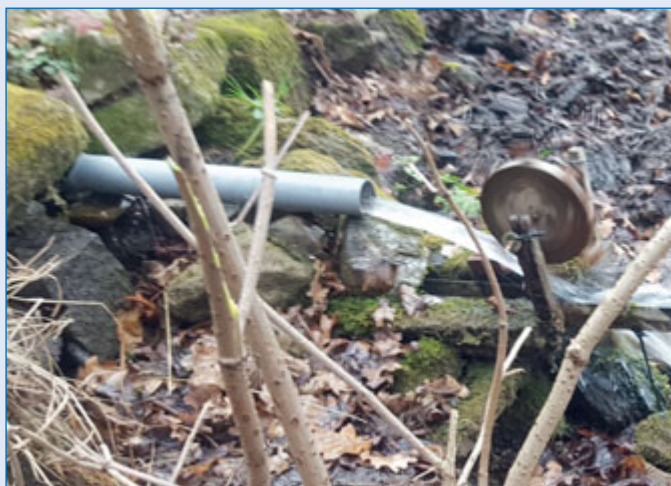
Neobvykle silný proud vody studánky U sovy roztácel i turbíny.