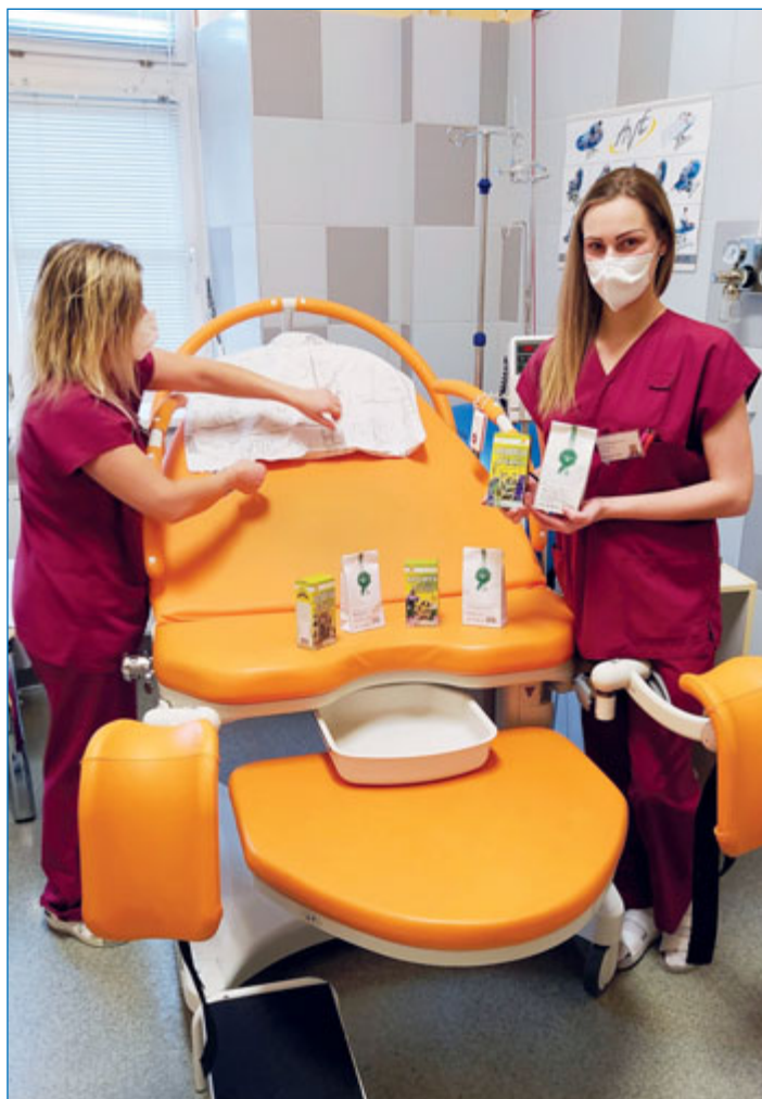
Sestřičky na porodním sále připravují bylinky.