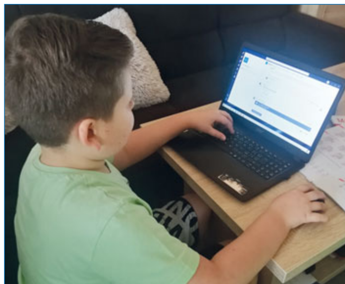
U počítače tráví děti při online výuce několik hodin denně.

Vlasta Mičková, oddělení pro dospělé čtenáře