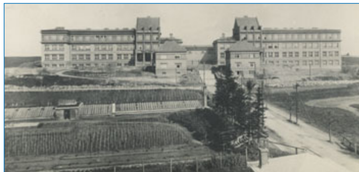
Stavba novojičínského českého reálného gymnázia zřízeného v roce 1921.

1921 – před 100 lety bylo v Novém Jičíně zřízeno české reálné gymnázium, bylo oslaveno třísté jubileum kaple Bolesné Panny Marie zvané Španělská a uskutečnil se Katolický den; 15. února se uskutečnilo podle zákona č. 256/1920 Sb. první Československé sčítání lidu, 3. listopadu se narodil básník a bývalý předseda Klubu rodáků a přítel města Nového Jičína Jaroslav Merenda