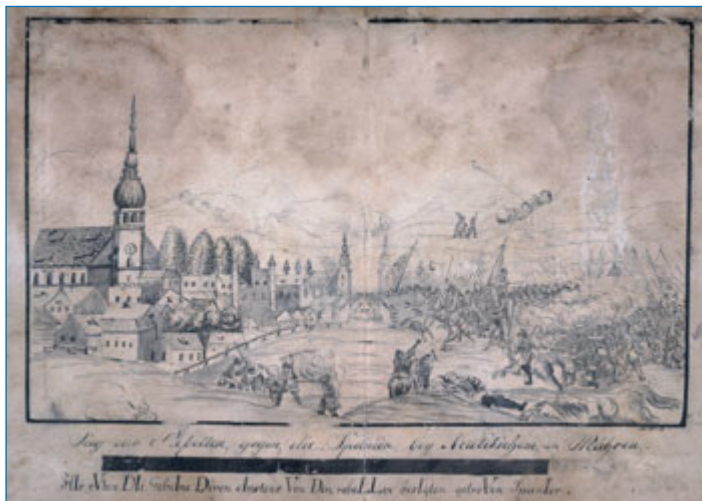
Veduta bitvy u Nového Jičína roku 1621.