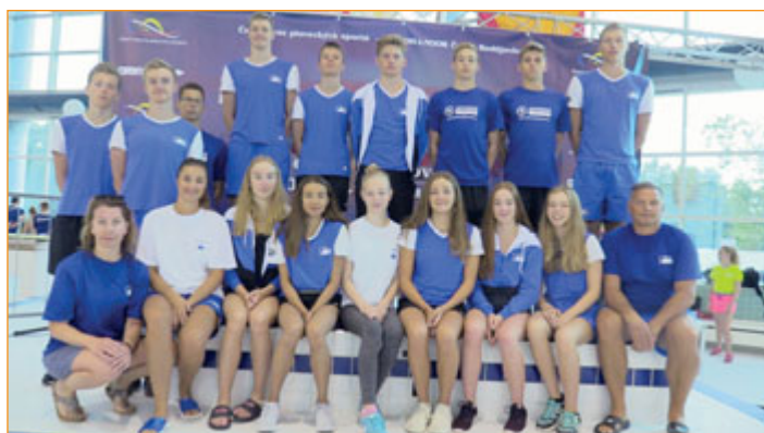
Naši plavci dosáhli historického úspěchu.