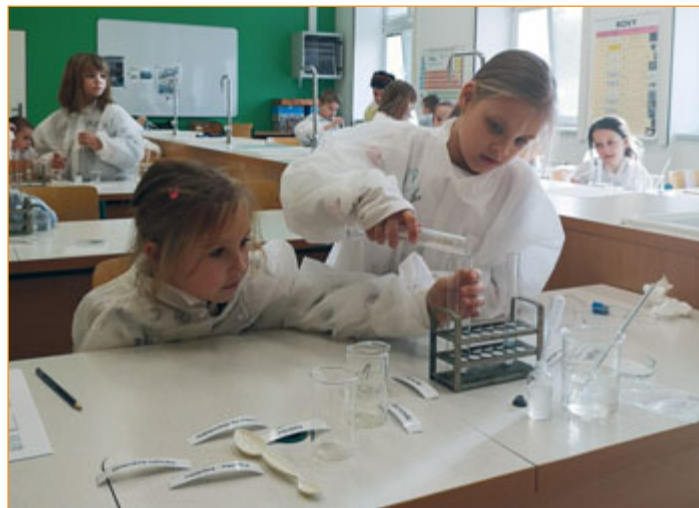
Zvládnout náročnou výuku žákům pomáhá i projekt Mladý laborant.