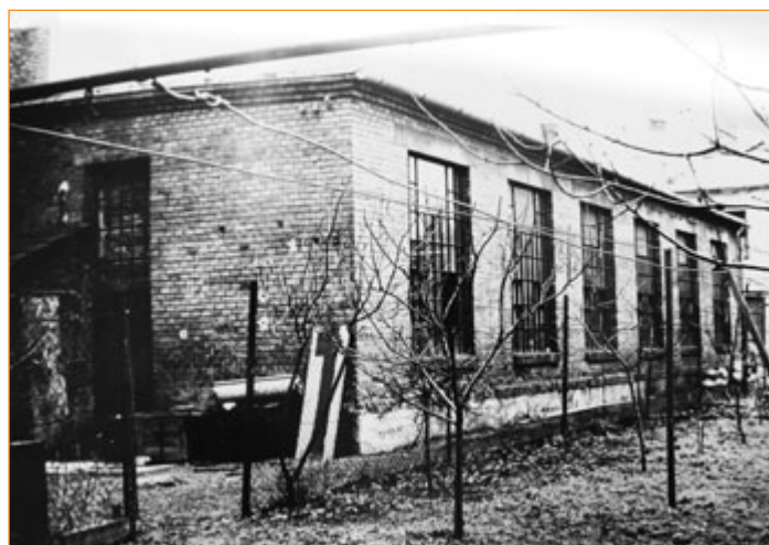
Původní Rotterova dílna v ulici Dolní brána v 60. letech minulého století.

V letech 1959 až 1960 byl v Autopalu vyvinut a zaveden do výroby asymetrický světlomet. Autopal byl první ve východním bloku a druhý na světě, který tento sortiment dokázal vyrábět. Od roku 1958 byl monopolním výrobcem svítidel motorových vozidel a letadel a výrobcem chladičů motorových vozidel všech finálních výrobců.