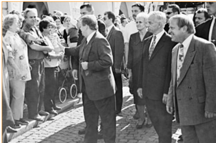
Prezident se na náměstí zdraví s obyvateli města.

Poté odjel do nedalekého Štramberku, kde v hotelu Gong přenočoval.