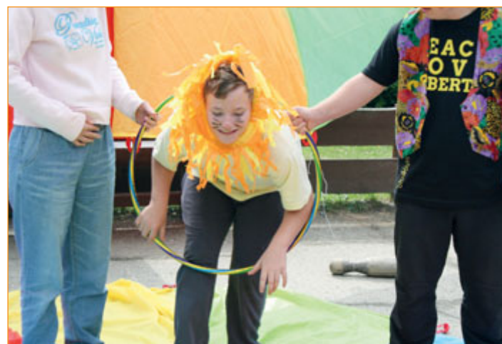
Nezapomenutelný výlet do světa cirkusu.