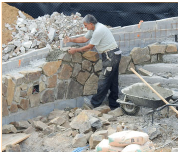
Vstup do Žerotínského zámku mění svůj vzhled.