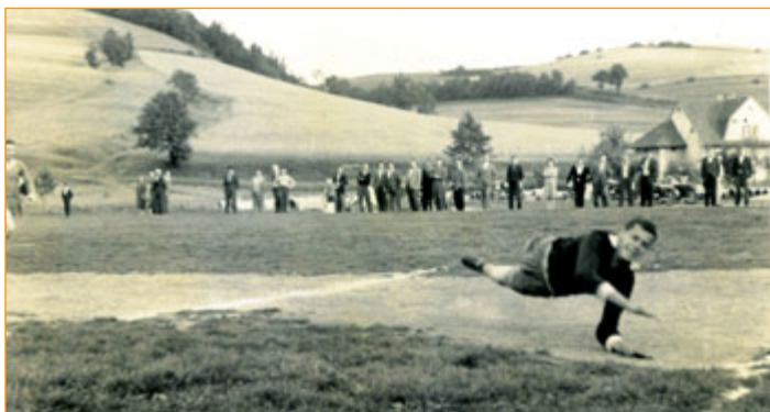
Fotbalové utkání TJ Sokol Straník na prvním hřišti na dolním konci u mlýna.

Činnost spolku byla tedy od samého počátku spojena i s ochot-