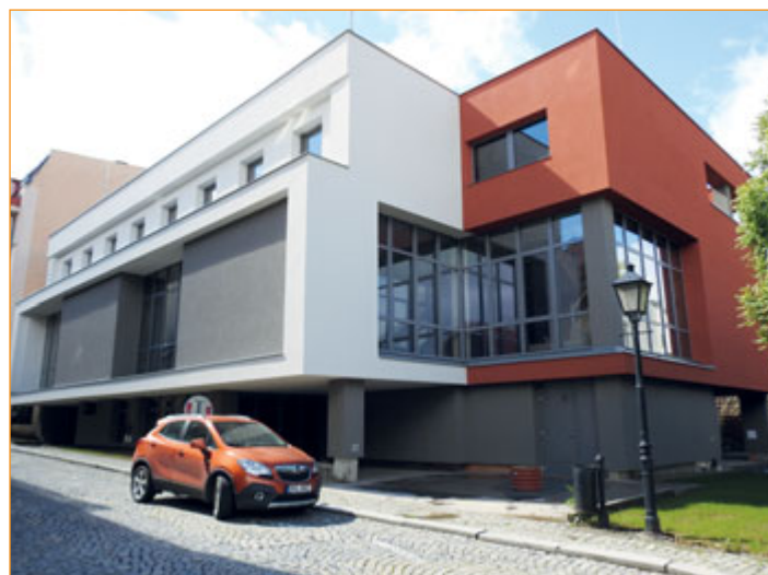
Přístavba Hotelu Praha před úvodní etapou rekonstrukce (vlevo) a po jejím dokončení.