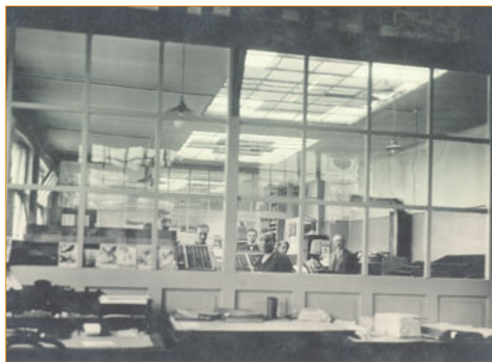
Sazárna téže tiskárny ve 20. letech minulého století.