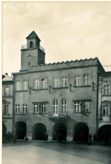
Radnice po přestavbě z let 1929 až 1930.

Podle projektu domácího stavitele Tomáše Chytila dostala dosud jednopatrová budova v roce 1861 podobu novogotické dvoupatrové stavby, kde našla své místo také místní reálka a první novojičínské muzeum. Radikální přestavba z let 1929 až 1930 zanechala z historické budovy pouze torzo. V podstatě zůstal zachován jen monumentální mázhauz. Ani to však neubralo nic na působivosti objektu. Moderní háv průčelí jako by s veškerou samozřejmostí dotvářel malebný kolorit náměstí a svým pojetím nenechal nikoho na pochybách, že zde se nachází první dům města, jeho srdce a mozek.