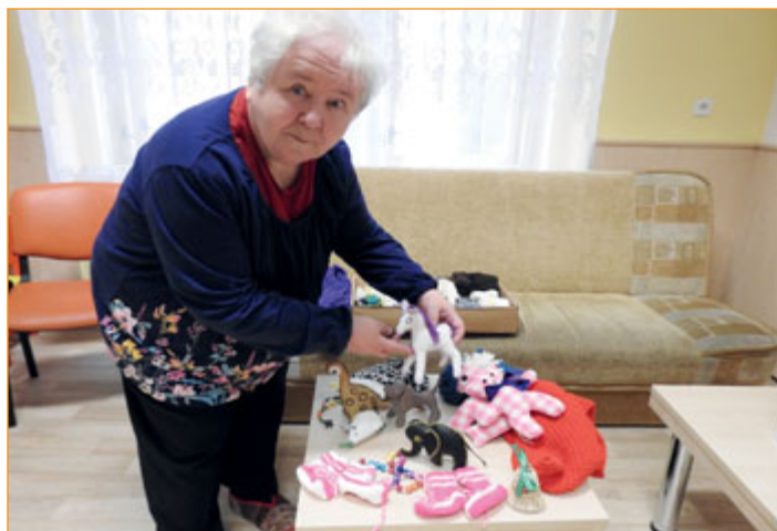
To všechno zvládl šikovně ruce členek charitního klubu.