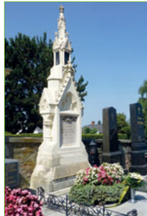
Newaldův hrob s kyticí od Klubu rodáků.

Přivolaná policie situaci špatně vyhodnotila a zabránila dobrovolníkům v další pomoci zvoláním „Všichni zachráněni!“, přestože se v budově nacházely ještě stovky lidí. Na úzkých neosvětlených chodbách a schodištích bez oken našlo smrt okolo 400 osob, mnoho z nich bylo umačkáno ve vstupních dveřích, které se otevíraly dovnitř, záchraně nadosah.