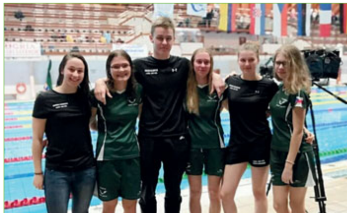
Novojičínští ploutvaři reprezentovali Česko v Egeru.

Novojičínský zpravodaj, s využitím tiskové zprávy