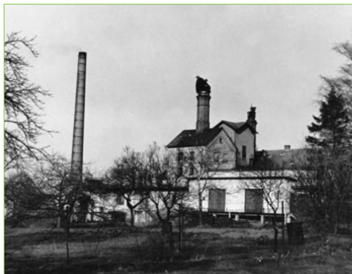
Snímek pivovaru z padesátých let minulého století.

Koncem šedesátých let měl pivovar roční produkci 72 tisíc hektolitřů piva. Vedle pivovarského komplexu existoval také hospodářský statek o výměře přesahující 62 hektary, který se svými šedesáti kusy dobytka zásoboval novojičínské domácnosti až pěti tisíci litry mléka měsíčně.