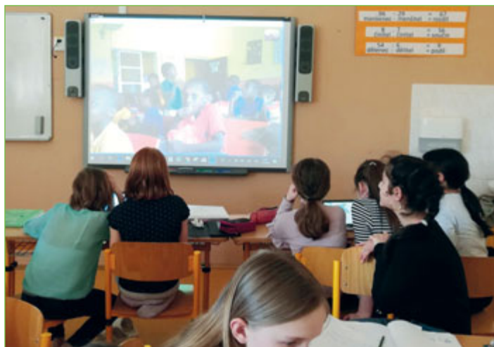
Virtuální setkání s vrstevníky z Nigérie.