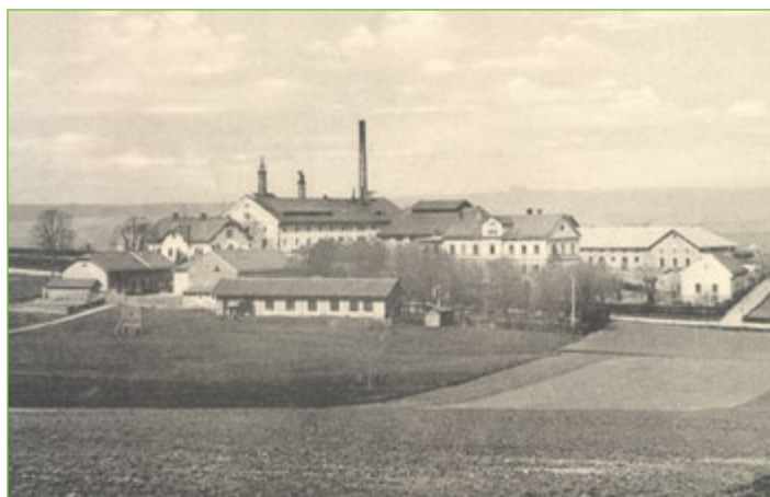
Pivovar Bocheta na počátku 20. století.

V mládí se stal nájemcem pivovaru v Kuníně, později pivovaru v Místku a u hrabat Seillernů ve Starém Jičíně. V roce 1864 zakoupil hostinec „zur Pochhütte“ v Loučce a následně zde vybudoval vlastní pivovar. Byl velmi šikovný podnikatel, který do procesu výroby piva zapojil také parní stroj.