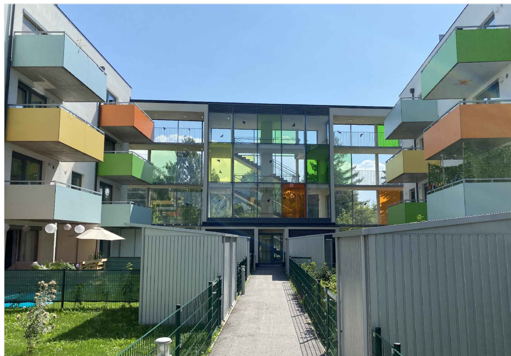
ZDROJ: St. Pölten, Ing. arch. Pavel Pekár - vlastní foto