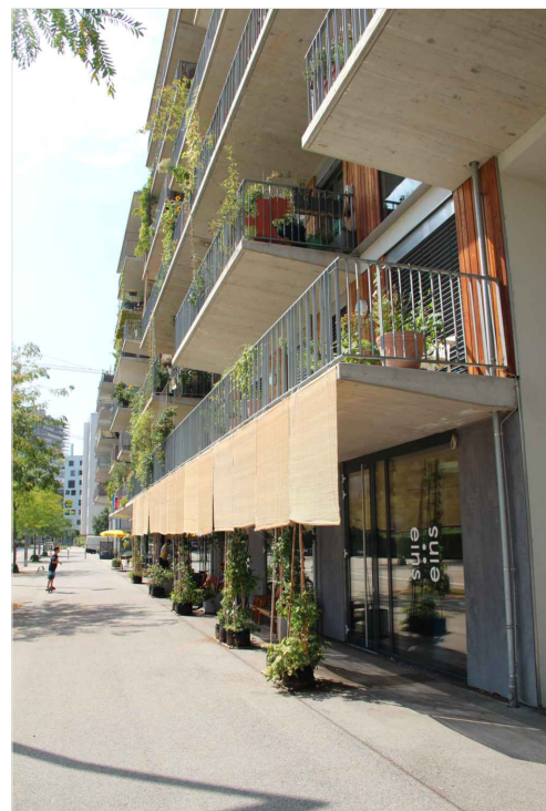
ZDROJ: Vídeň, Ing. arch. Bořek Knytl - vlastní foto