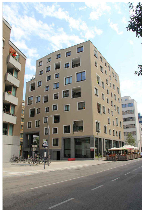
ZDROJ: Vídeň, Ing. arch. Bořek Knytl - vlastní foto