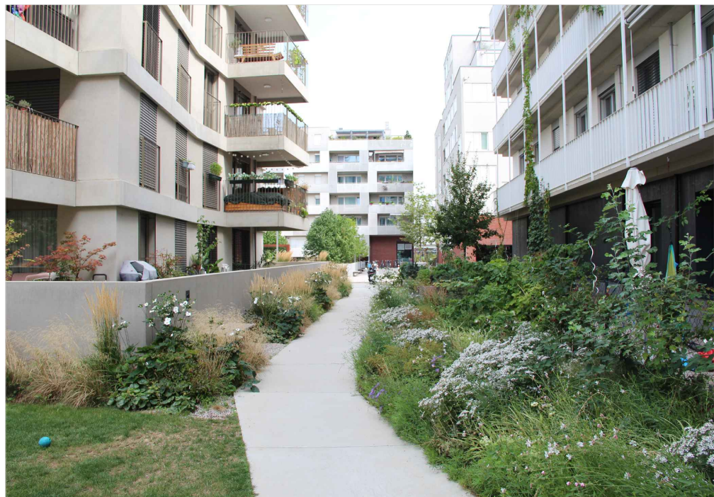
ZDROJ: Vídeň, Ing. arch. Bořek Knytl - vlastní foto