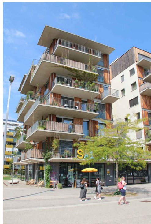
ZDROJ: Vídeň, Ing. arch. Bořek Knytl - vlastní foto