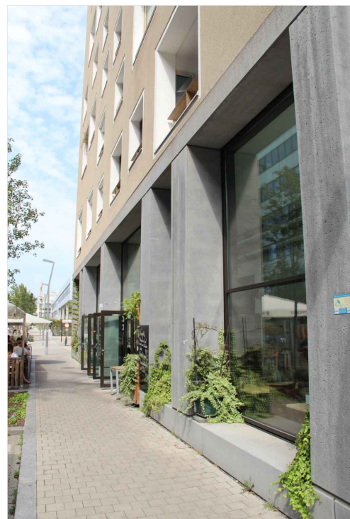
ZDROJ: Vídeň, Ing. arch. Bořek Knytl - vlastní foto