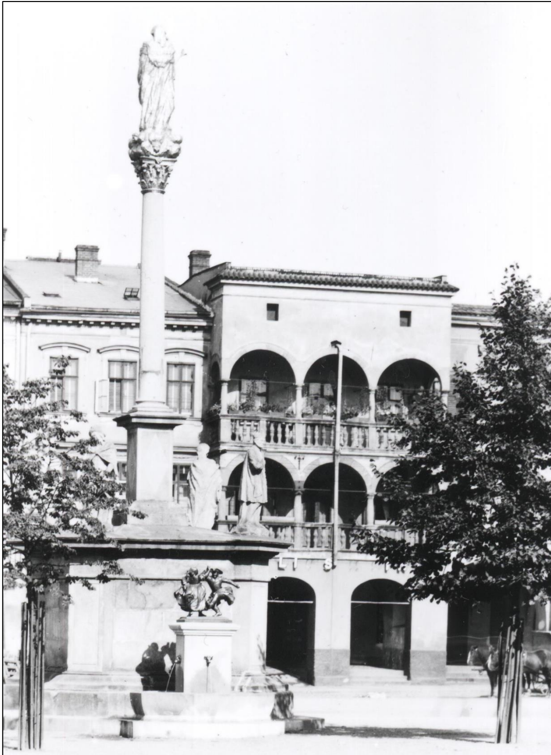
Příloha 3: Foto stromů na náměstí ze 30. let 20. století