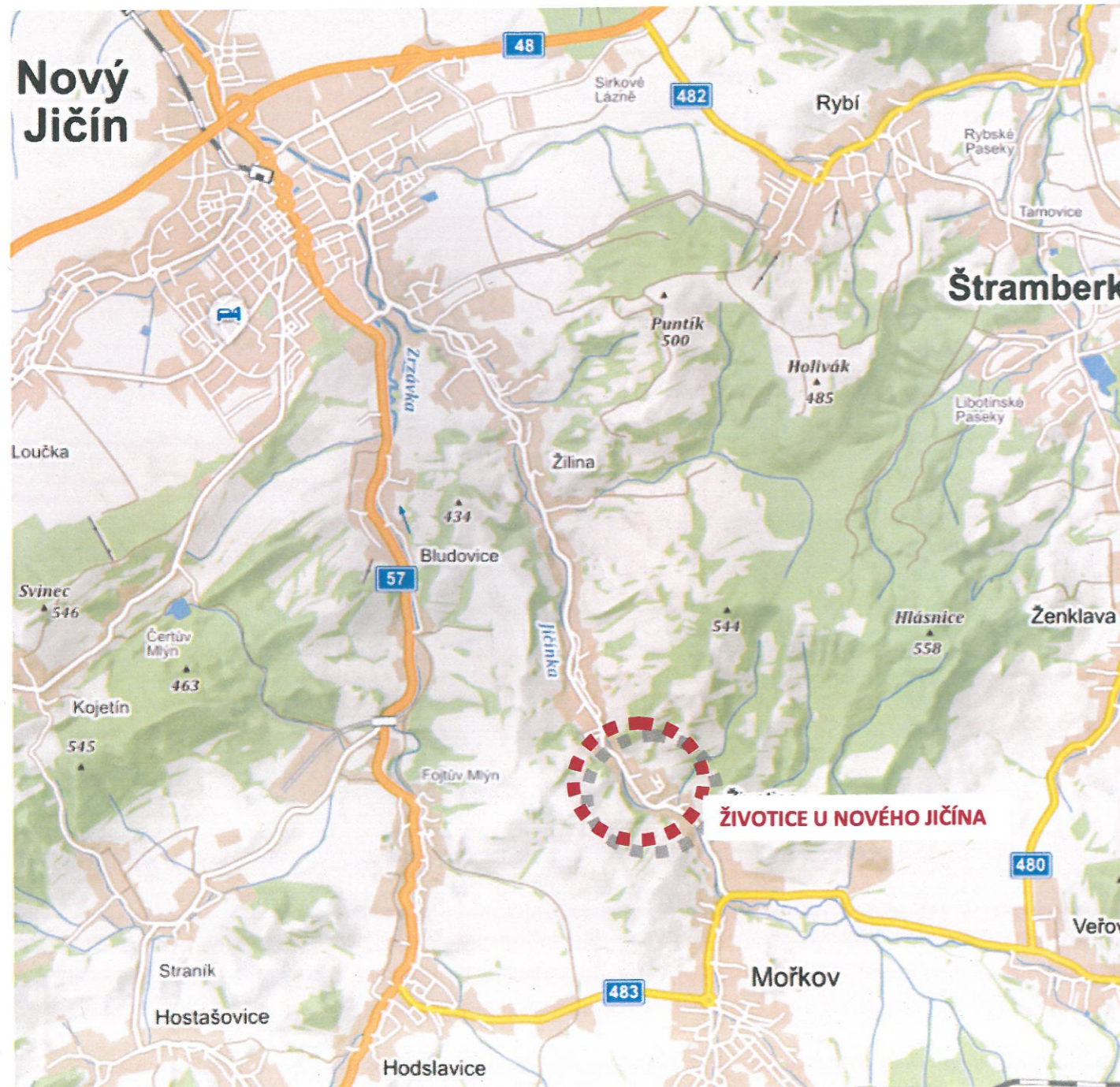
ŠIRŠÍ ÚZEMNÍ VZTAHY