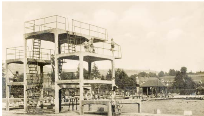
Skokanský můstek na koupališti, třicátá léta 20. století.