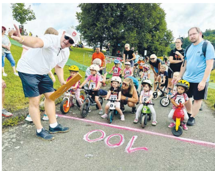
Start jedné z dětských kategorií, 2024.