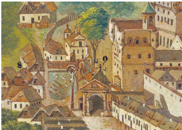
František Kledenský: Veduta města Nového Jičína z roku 1744, detail rybníku na Horní bráně při zámku.

Doba dovolených a vysokých letních teplot si v Novém Jičíně ode dávna žádala přístup k vodnímu zdroji. Koupací místa ve městě samozřejmě byla už v jeho rané historii, zvláště u splavů Žilinského potoka (dnes řeka Jičínka) nebo u potoka s názvem Grasmanka. Tam ještě na konci 19. století existoval menší plavecký bazén. Vedle toho se zřídily tzv. sluneční lázně, kde občané města trávili příjemné chvíle. Principy této lázeňské léčby vycházely z darů okolní přírody a jejich základem bylo využívání vodních pramenů, pitné léčby a inhalací. Znamé byly rovněž Sirkové lázně (areál směrem na obec Rybí) a Rudolfovy lázně poblíž kloboučnické továrny Johann Hückels Söhne (dnes TONAK). Zájem o koupání v letních měsících byl velký, občané Nového Jičína využívali rovněž dalších vodních zdrojů jako byl Křivý potok v části Žilina nebo rybník poblíž Žerotínského zámku vně hradebního opevnění. Zdrojů vody měl Nový Jičín vždy dost, už kvůli pramenům na Skalkách a jejich rozvodů nejen pro městský pivovar, ale i zdejší studny.