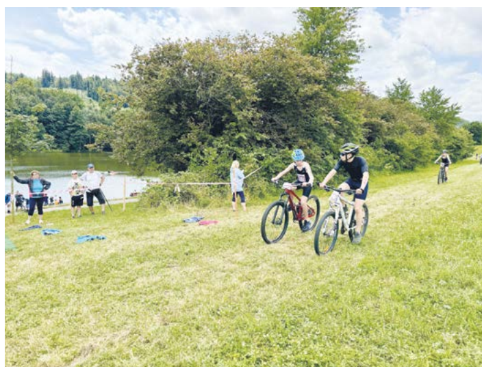
Mladí závodníci na cyklistické trati nad vodní nádrží Čerták, 2025.