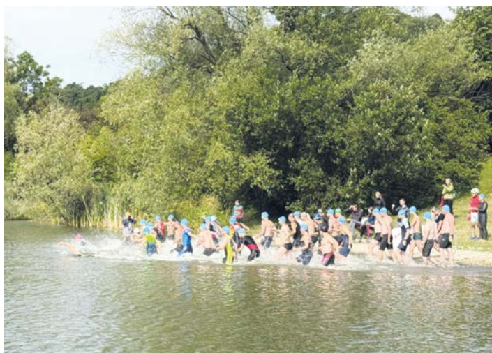
Start mužů, 2025.