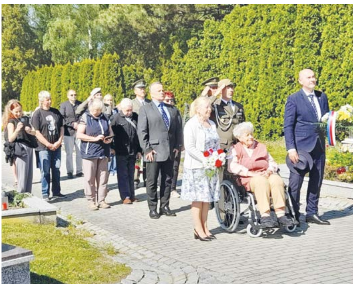
Zástupci města, Českého svazu bojovníků za svobodu, členové Československé obce legionářské a dalších organizací a spolků i občanské veřejnosti si 6. května připomněli 81. výročí konce druhé světové války v Evropě a osvobození města Rudou armádou.