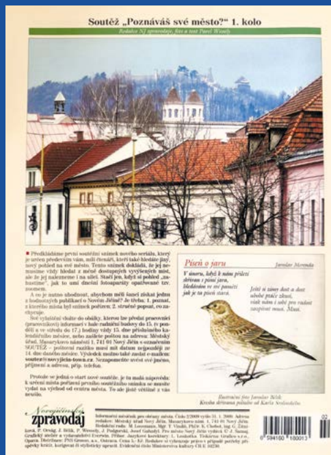
První soutěžní snímek zveřejněný v únorovém vydání Novojičinského zpravodaje v roce 2009.