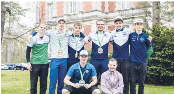
Členové Moravian Gators Nový Jičín na turnaji v polském Świerkanci.