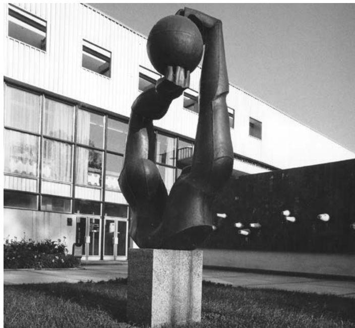
Umělecké ztvárnění nástupu do areálu bazénu, osmdesátá léta 20. století.