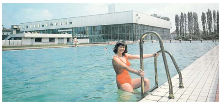
Venkovní bazén v roce 1985.