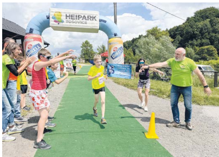
Mladý závodník v běžecké části Hobby Čerták triatlonu dává do závodu maximum energie, 2025.