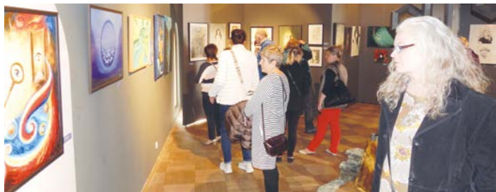
Přehlídka tvorby novojičínských výtvarníků v Žerotínském zámku přilákala rekordní počet zájemců.

Ještě do 21. června potrvá unikátní výstava prací 11 regionálních umělců s vazbami na naše město, která byla 14. května zahájena v Nové galerii Žerotínského zámku. Představuje nejružnější výtvarné techniky: olejomalbu, kresbu, akvarel, grafiku, tisk, autorské plakáty, plastiky i práce s broušenými kameny. Vedle realismu je zde zastoupena symbolická i abstraktní tvorba.