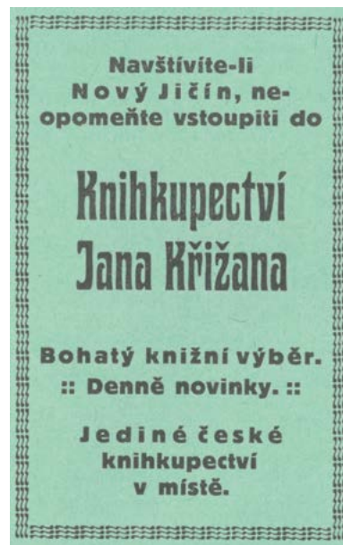
Jedna z mnoha reklam na Křížanův obchod (1919).

Martin Vitko, Státní okresní archiv Nový Jičín