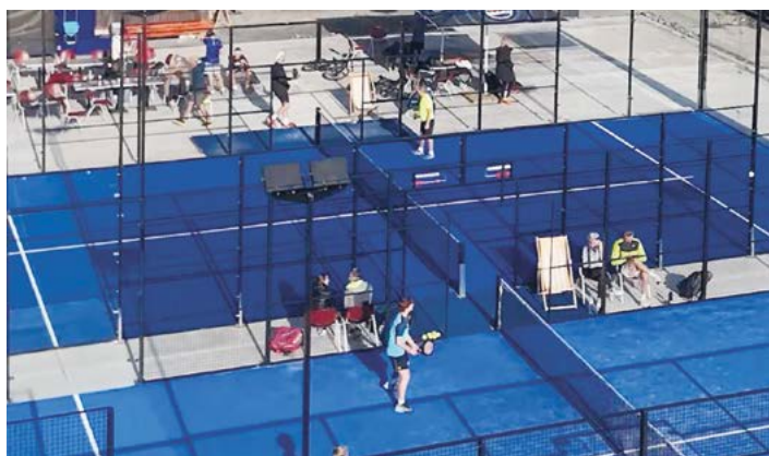
Padelové kurty v Novém Jičíně.

Padel se hraje ve čtyřech hráčích na menším kurtu obklopeném skleněnými stěnami, od kterých se míček může odrážet. Hra je díky tomu velmi dynamická a přináší mnoho zajímavých výměn. Právě jednoduchost základních pravidel a menší fyzická náročnost oproti některým jiným raketovým sportům činí padel ideální aktivitou i pro začátečníky.