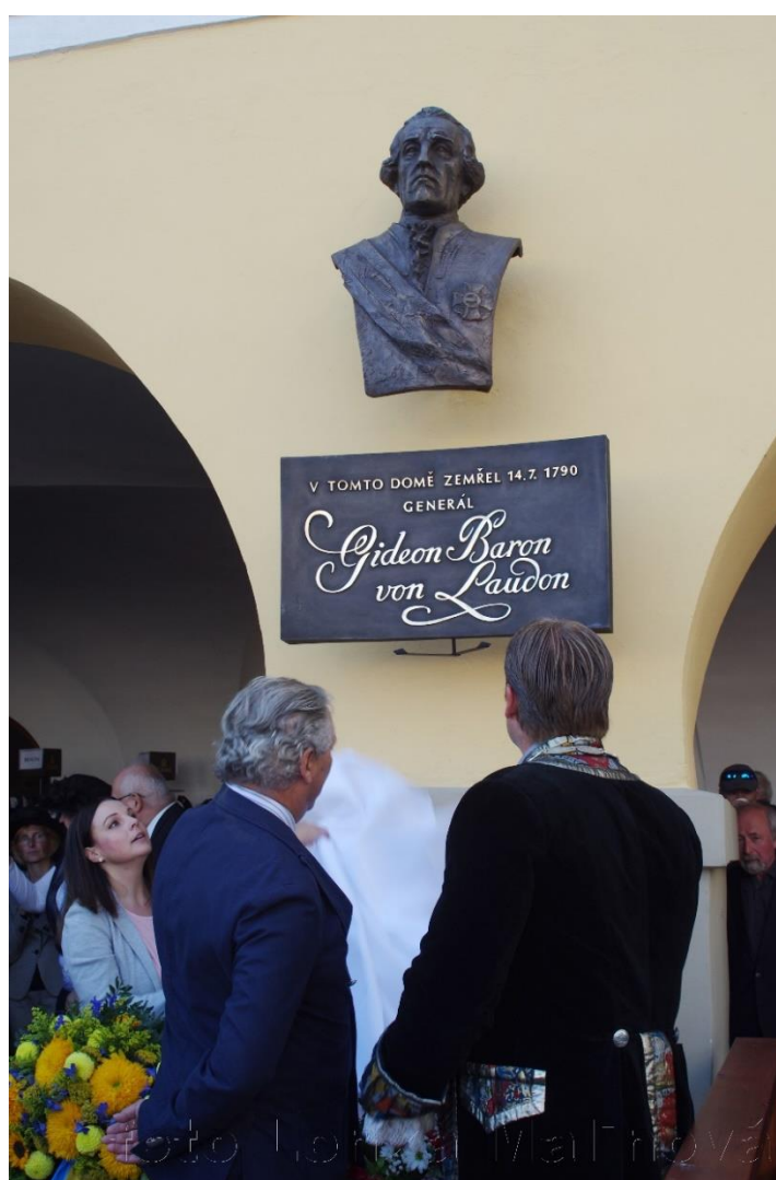
Odhalení busty G. Barona von Laudona