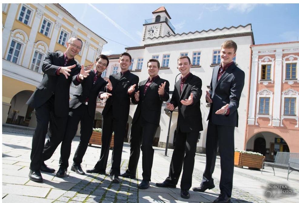
Vokální seskupení Sextet+ Nový Jičín vydalo v roce 2017 již své třetí CD a na Mezinárodní soutěži dětských a mládežnických sborů získalo Zlaté pásmo