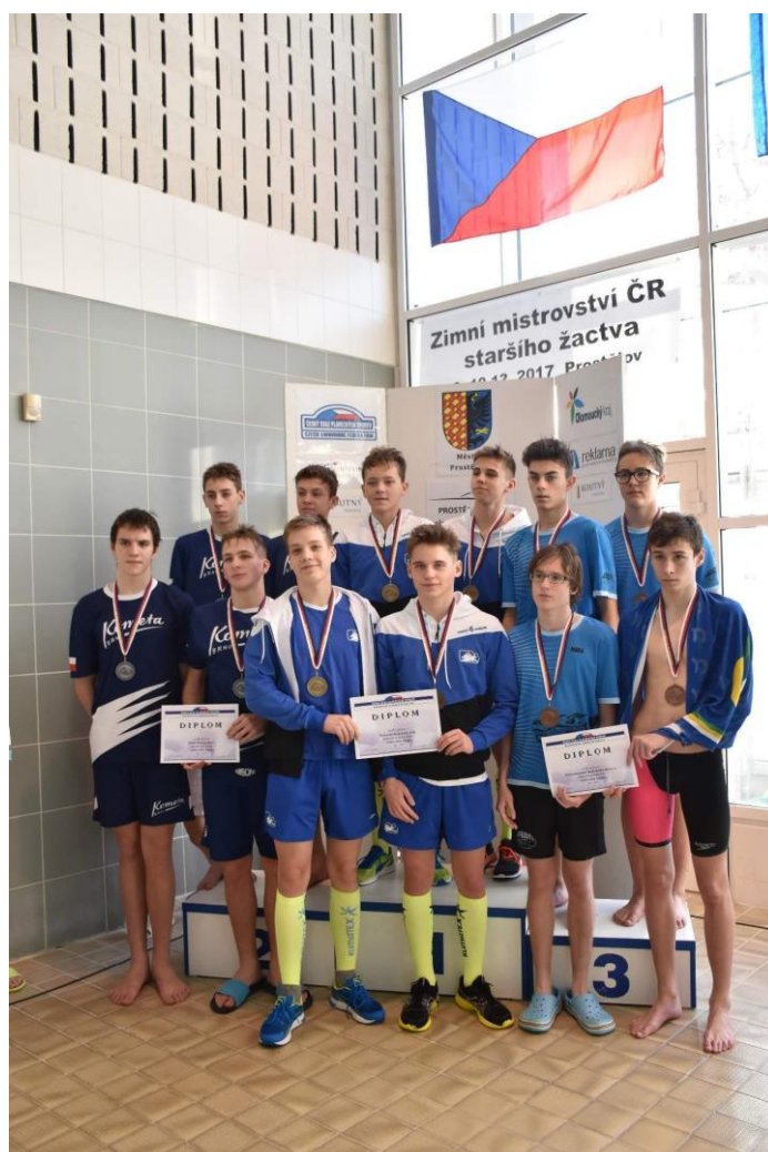
Zimní mistrovství České republiky, Prostějov, štafeta – 1. místo