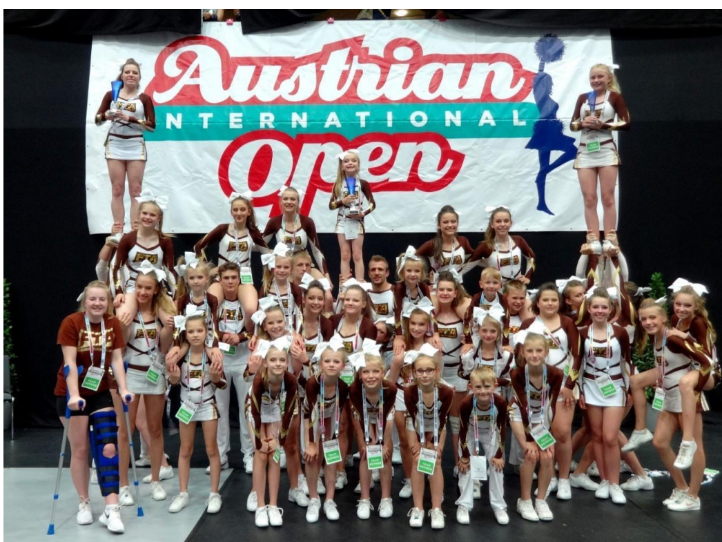
Austrian International Open, získá tři pohárů (každý ze tří týmů si odvezl jeden pohár, a to dvakrát za první a jednou za druhé místo)