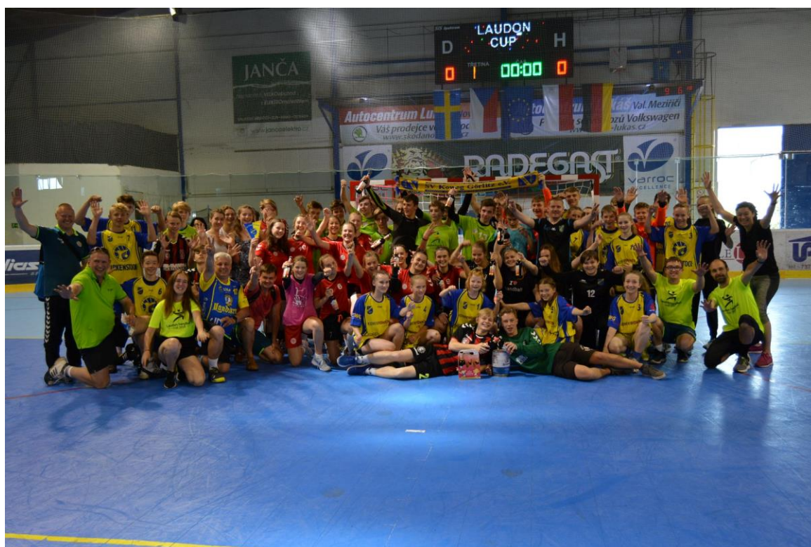
Laudon handbal cup, 21. května 2017