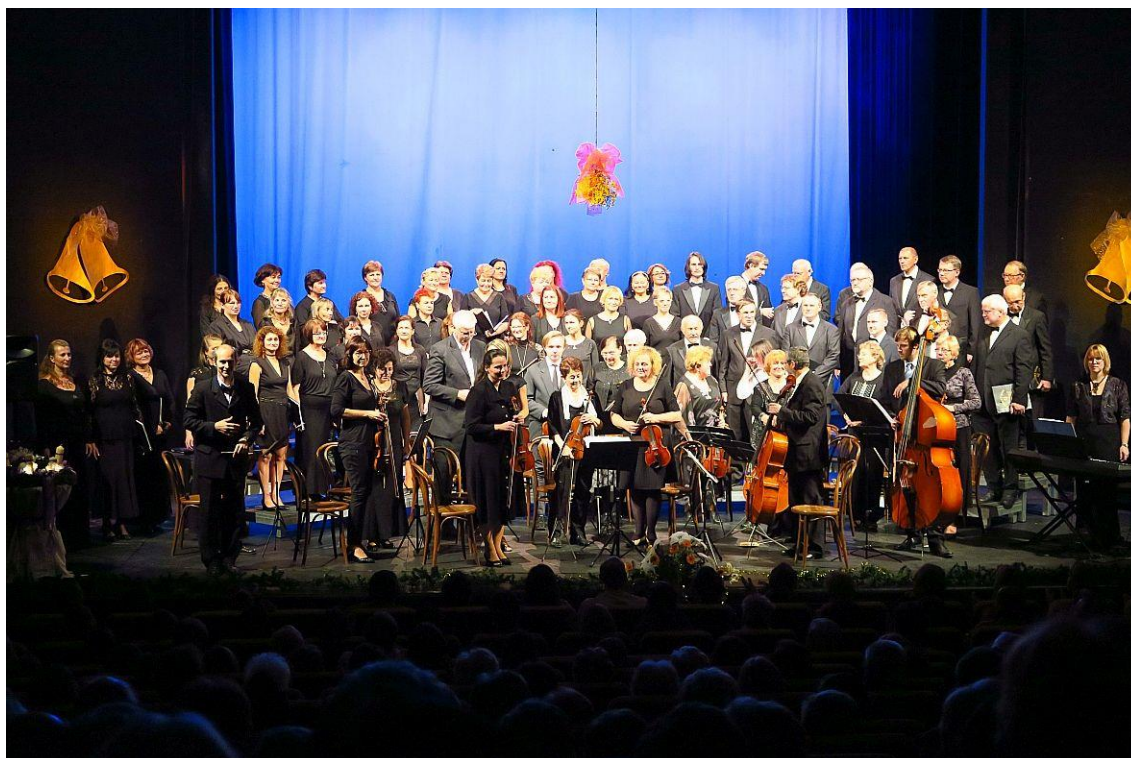
Adventní koncert, 15. prosince, Beskydské divadlo Nový Jičín