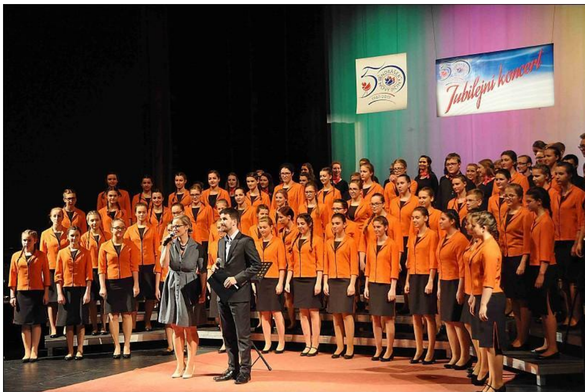
Jubilejní koncert v Beskydském divadle, březen 2017

Novojičínský pěvecký sbor Ondrášek při ZUŠ Nový Jičín slavil 50 let své činnosti