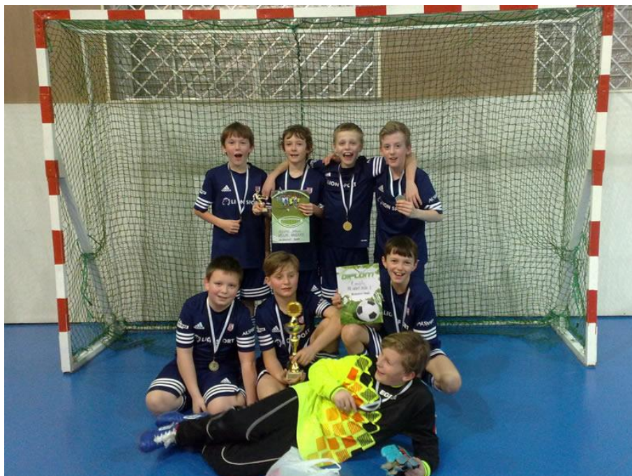
Mladší žáci U 13, únor 2017