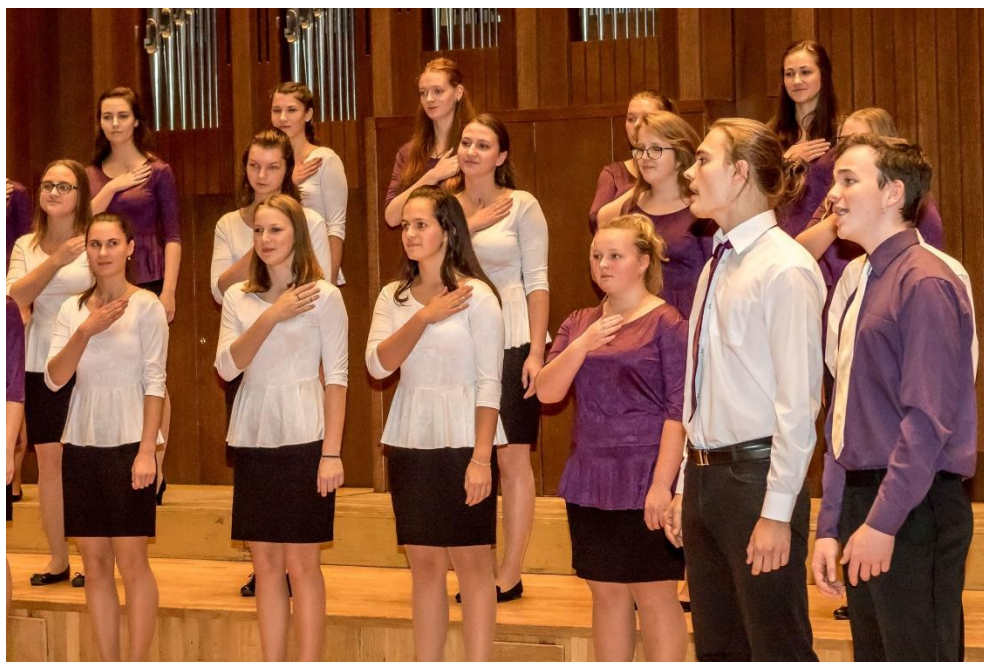
Mezinárodní soutěž dětských a mládežnických pěveckých sborů s cenou Miroslava Reichla, Zlaté pásmo