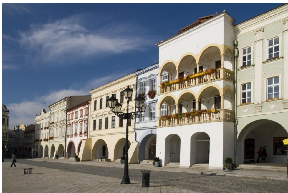
Nově zrekonstruovaná budova Staré pošty na Masarykově náměstí