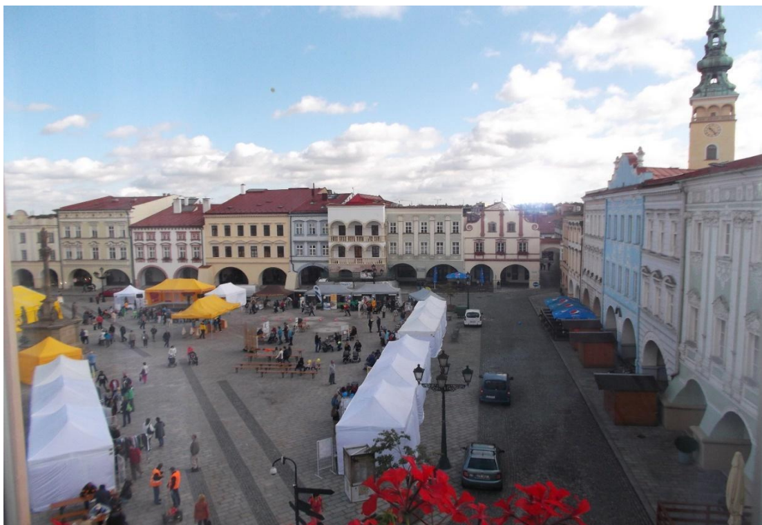
Velikonoční jarmark, duben 2017