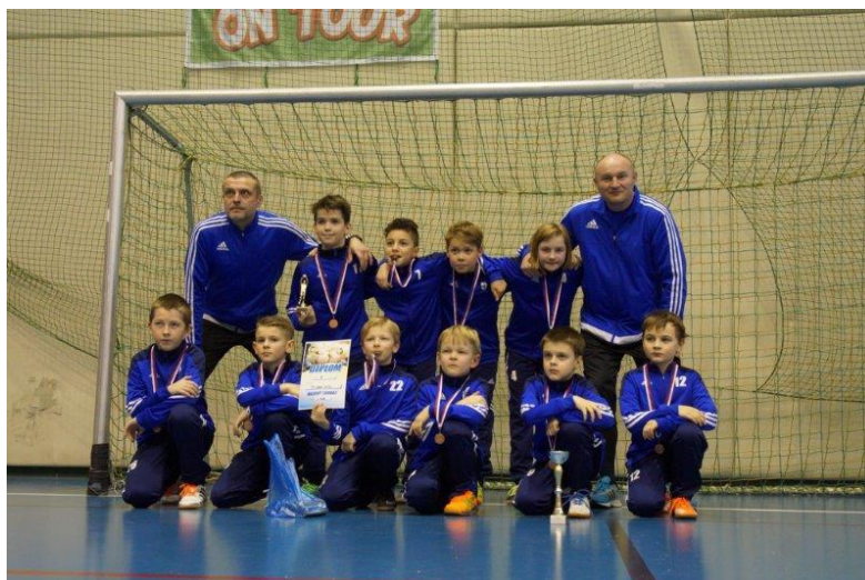
Starší přípravka U 10