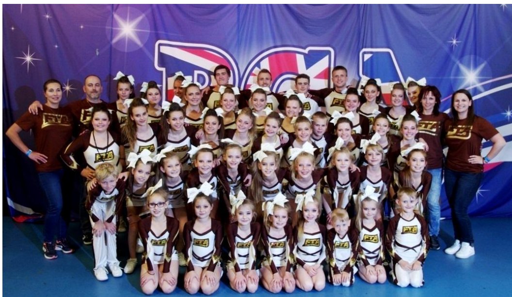
BCA Super Classic, Newcastle, získá dvou pohárů (druhé a třetí místo)